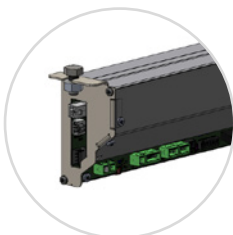
Connectique accessible sur boîtier logique